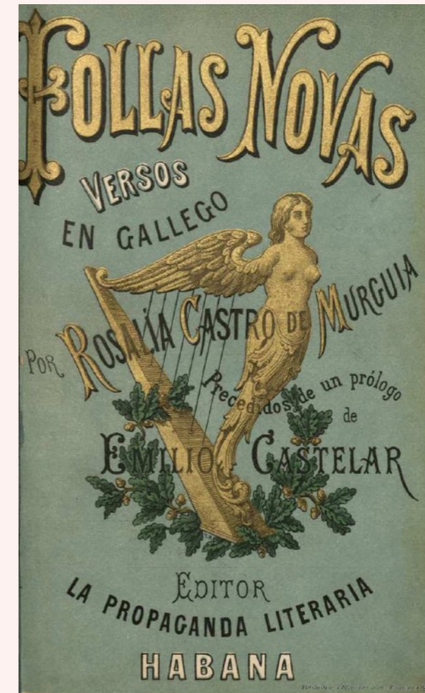
Capa da primeira edición de Follas Novas