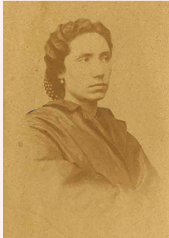
Fotografía de Rosalía