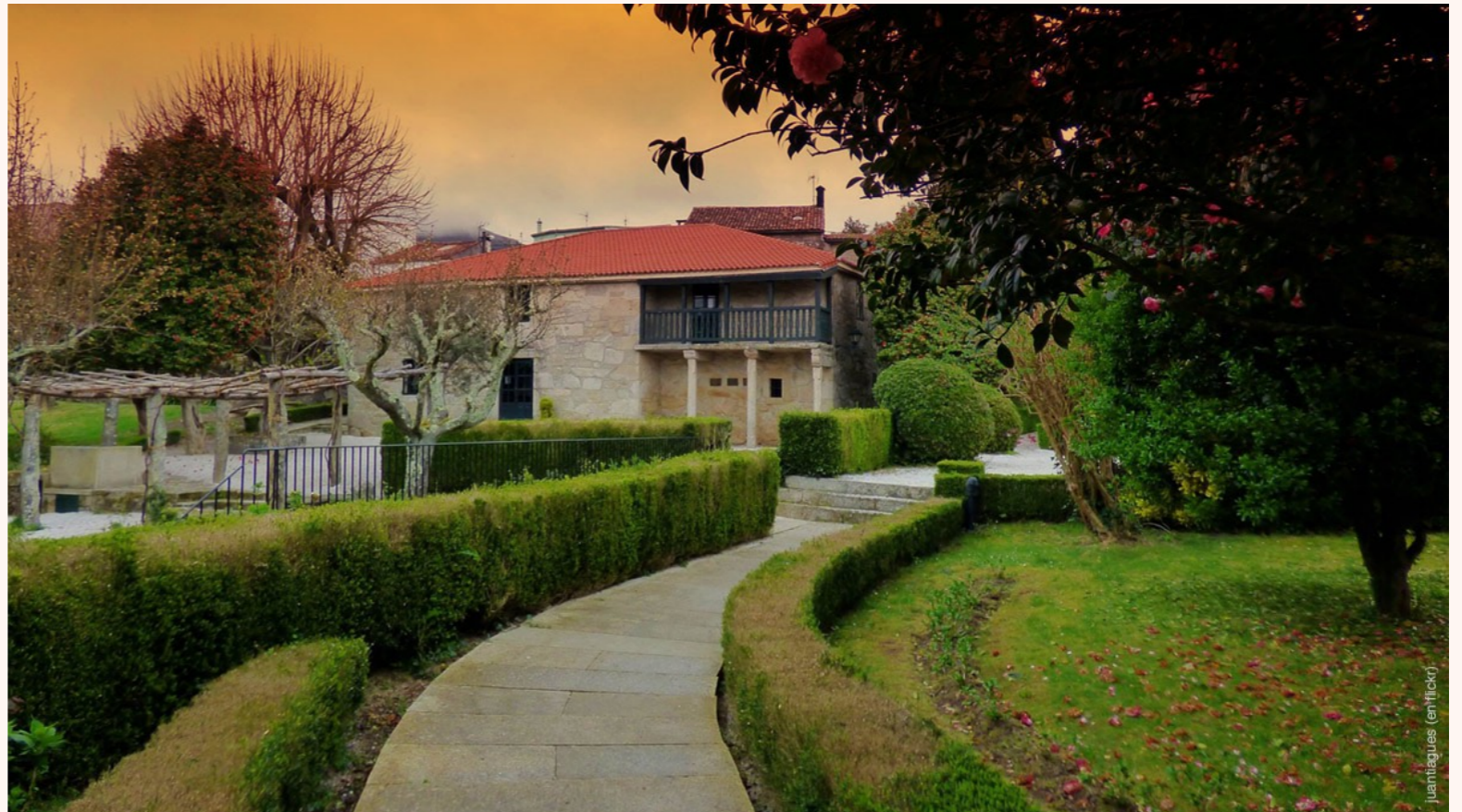
O xardín da Casa de Rosalía

No exterior aínda teremos ocasión de gozar dos xardíns e nos achegar ao Loureiro dos Poetas, á figueira de Rosalía, á Camelia híbrida Rosalía de Castro, ao carballo de Gernika e ao maxestoso ombú.