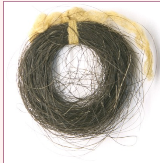
Guecho do cabelo de Rosalía, e á dereita, a súa cama