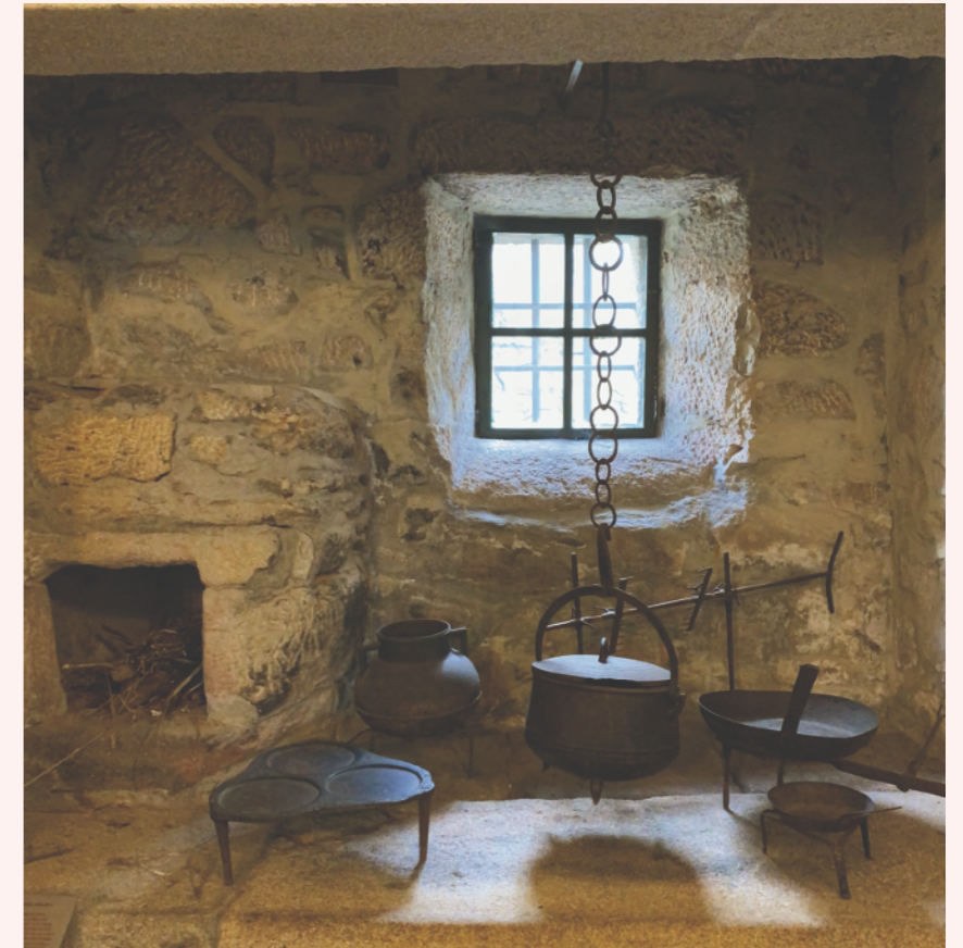
Unha das vistas da cociña da Casa de Rosalía