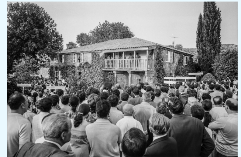
Fotografía do acto da Inauguración da Casa de Rosalía. Xosé Castro, 15 de xullo de 1971