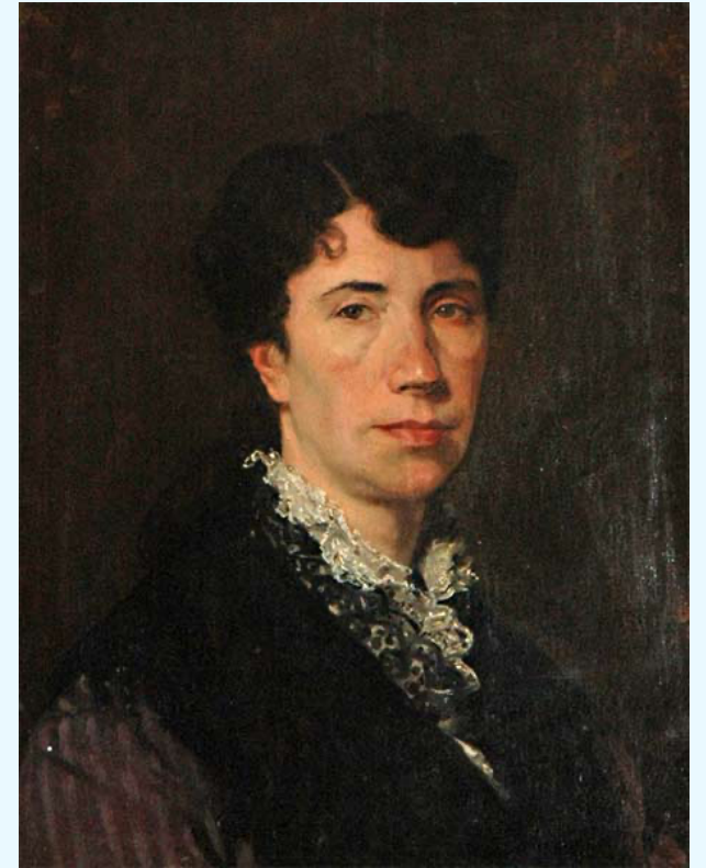
Retrato ao óleo de Rosalía, por Modesto Brocos