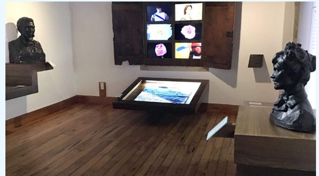
Os bustos de Murguía e Rosalía e no medio a bandeira de Camilo Agrasar, a bandeira de Rosalía