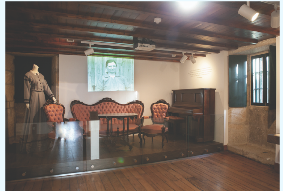
Sala co tresillo familiar, o vestido de Carme Pichel e o piano