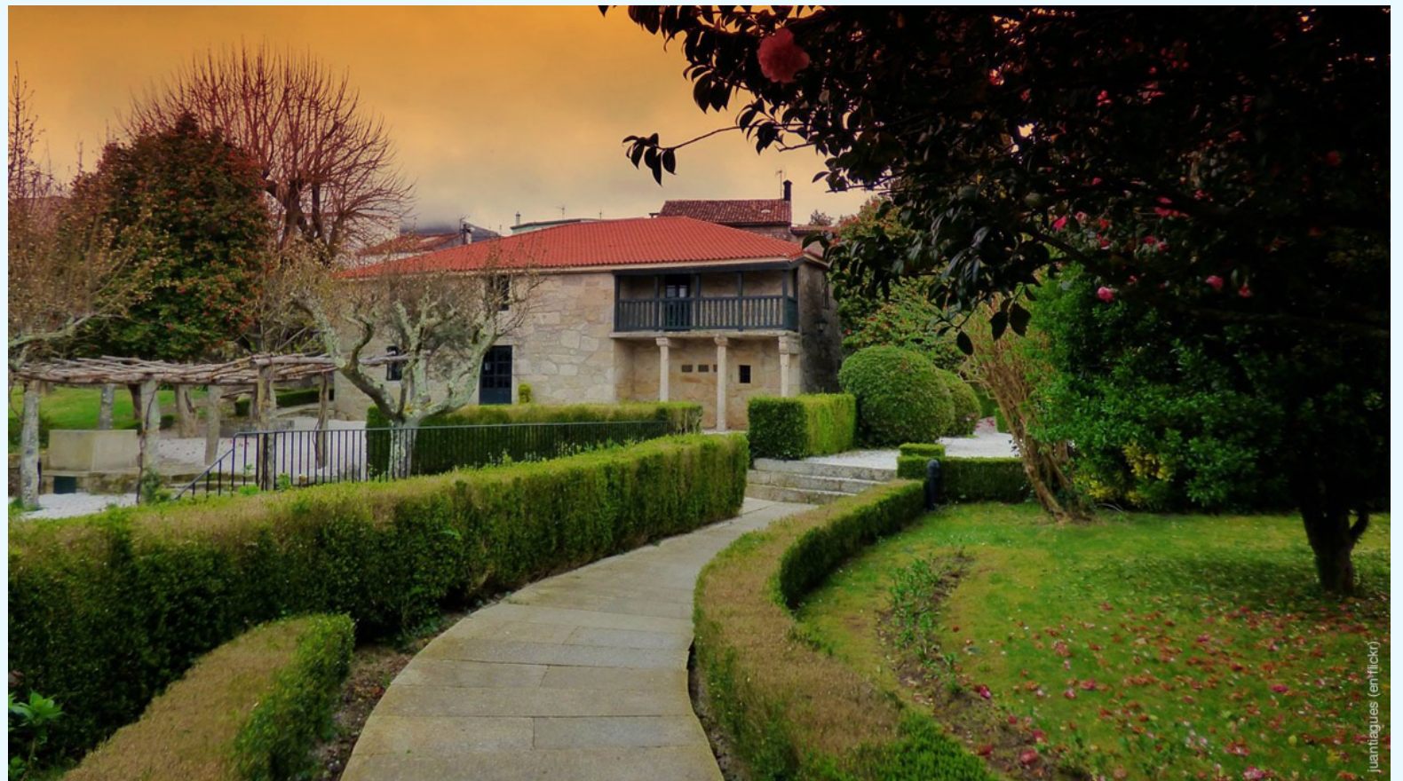
O xardín da Casa de Rosalía

No exterior aínda teremos ocasión de gozar dos xardíns e nos achegar ao Loureiro dos Poetas, á figueira de Rosalía, á Camelia híbrida Rosalía de Castro, ao carballo de Gernika e ao maxestoso ombú.