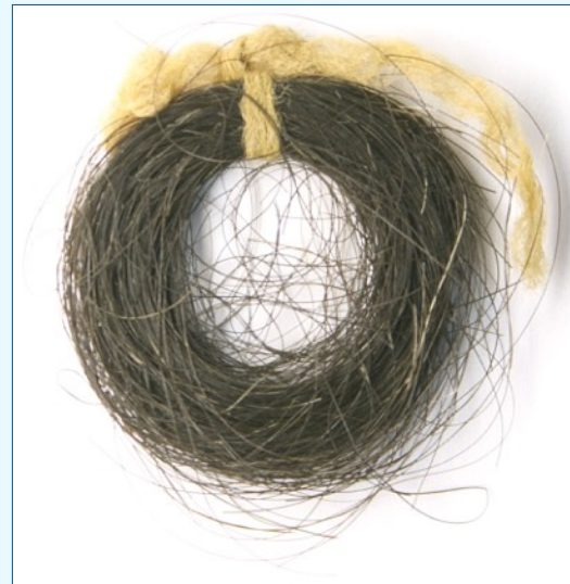
Guecho do cabelo de Rosalía, e á dereita, a súa cama