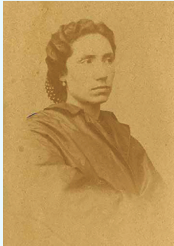
Fotografía de Rosalía