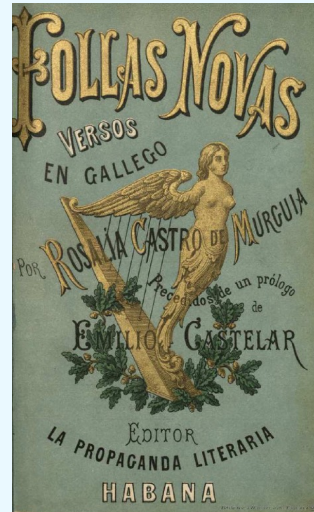
Capa da primeira edición de Follas Novas