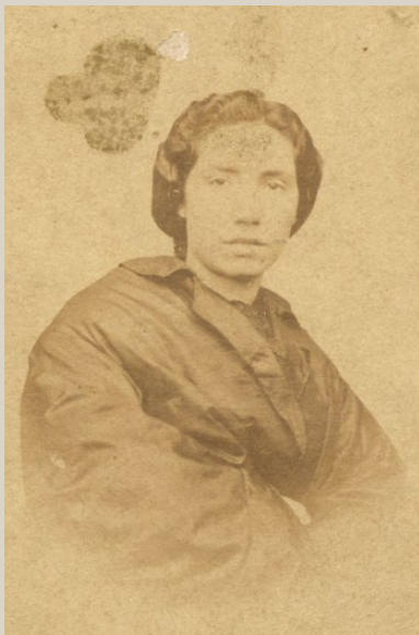
Rosalía