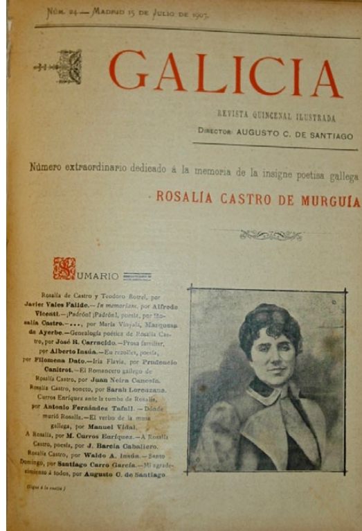
Abaixo: Ambas caras da reprodución fotográfica utilizada en Retrato de Mujeres Españolas del s. XIX , que se conserva na Biblioteca Nacional de España