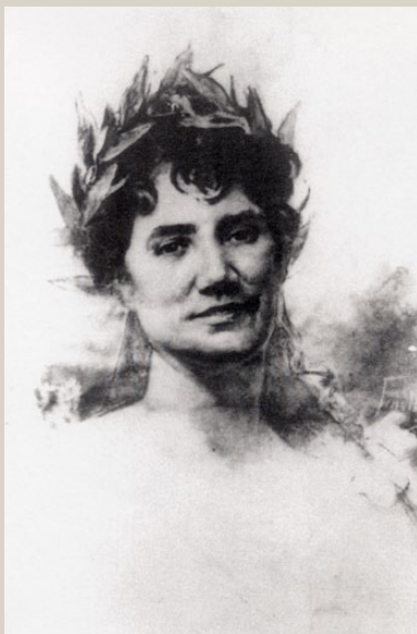
Rosalía por Fenollera

e deixaa só cunha coroa de loureiro –sorri mentres o imaxina–.