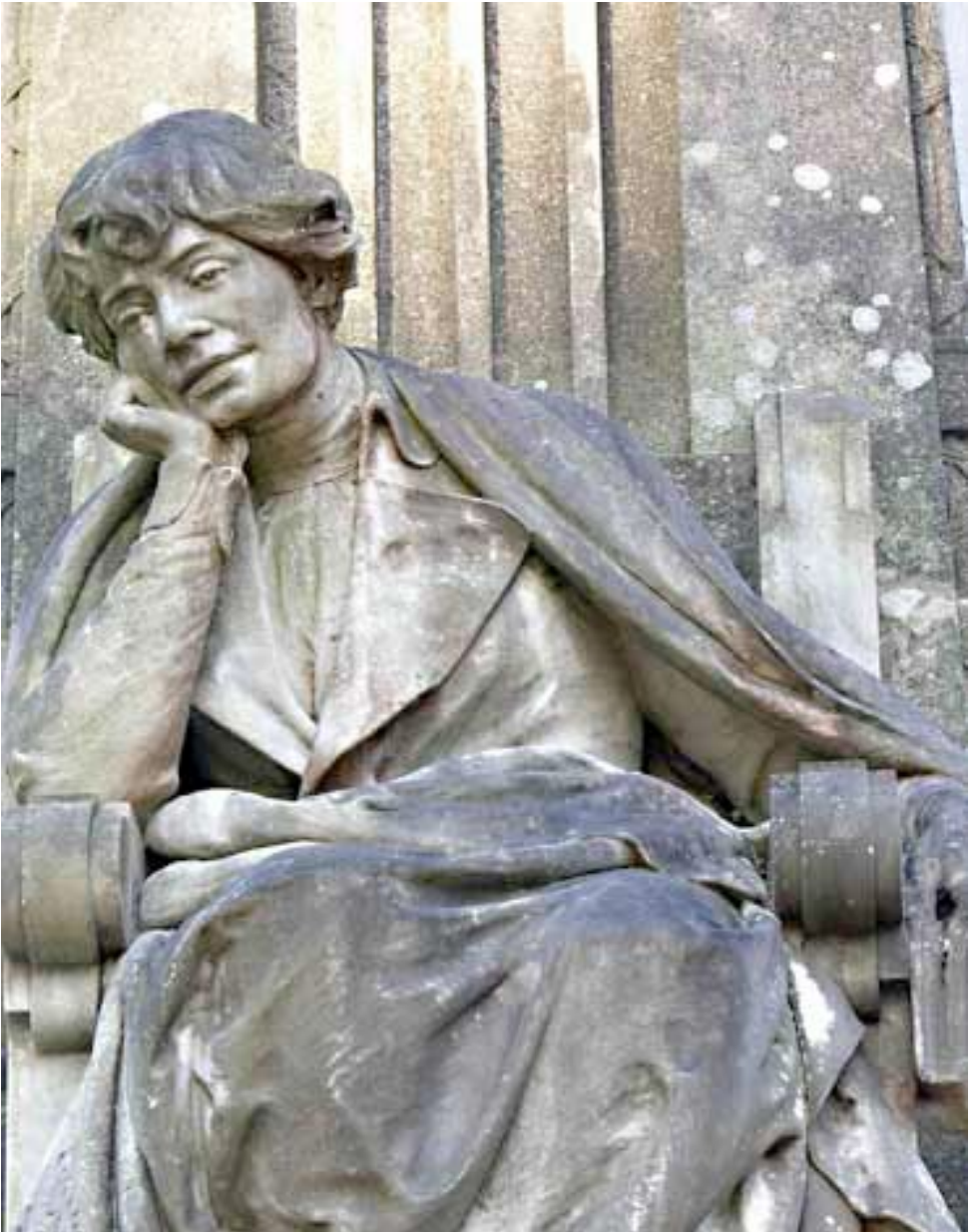
Escultura de Francisco Crivilles. Alameda de Santiago de Compostela. 1917